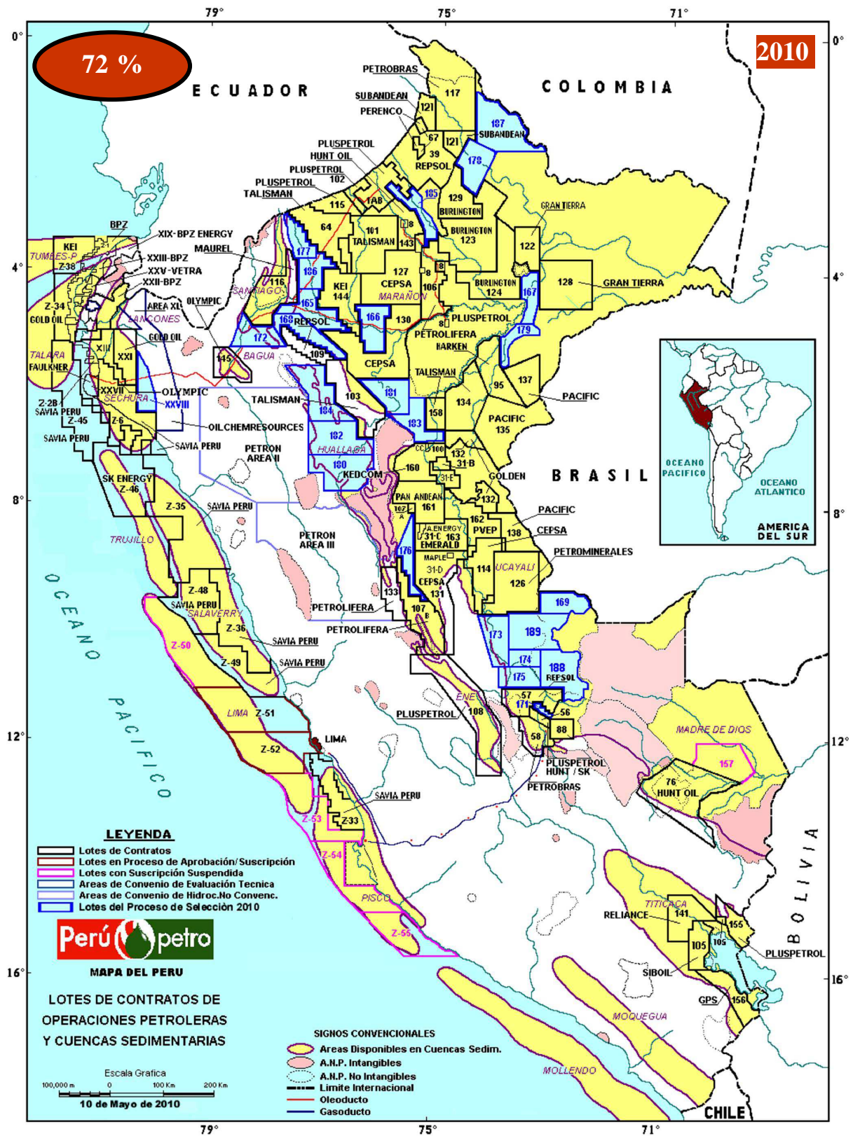
Cuadro 2: Concesiones de hidrocarburos